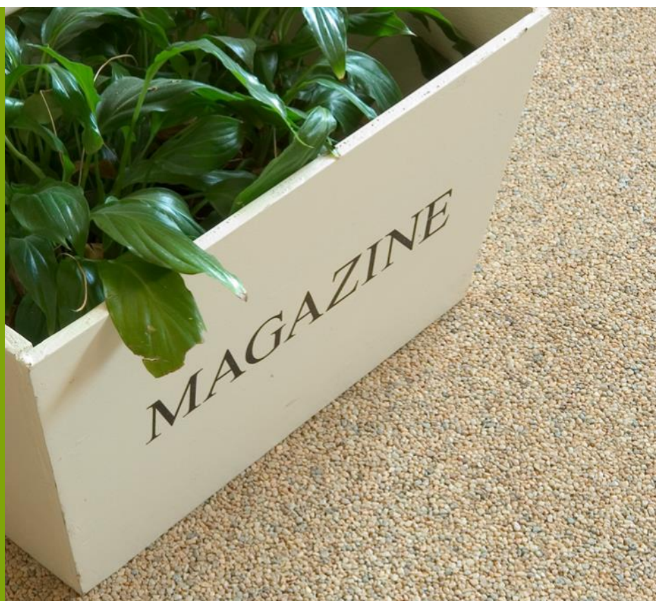
Natural brown grey

Σε εσωτερικό χώρο, με ηλεκτρική σκούπα, με σφουγγαρίστρα, με σκούπα κανονική, με σκούπα ατμού και φυσικά κάθε δυο η τρία χρόνια μπορεί και καθαριστεί και από συνεργείο καθαρισμού χαλιών. Στους δύσκολους λεκέδες χρησιμοποιείτε και τα πιο δυνατά καθαριστικά, όπως στα μάρμαρα και στις πέτρες.